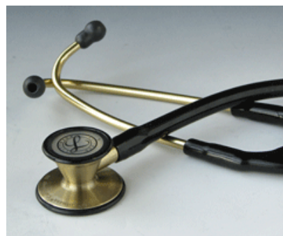
リットマン 聴診器